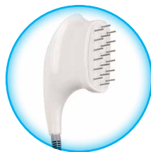
Выносной массажный электрод игольчатый