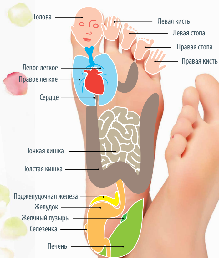
Система соответствия внутренних органов и частей тела на стопах (Су-Джок)

ИМЕЮТСЯ ПРОТИВОПОКАЗАНИЯ. ПЕРЕД ПРИМЕНЕНИЕМ ОЗНАКОМЬТЕСЬ С ИНСТРУКЦИЕЙ ИЛИ ПРОКОНСУЛЬТИРУЙТЕСЬ СО СПЕЦИАЛИСТОМ