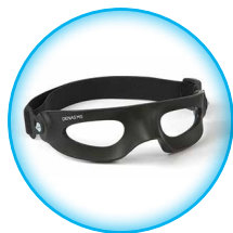
Электрод терапевтический параорбитальный ДЭНАС-Очки