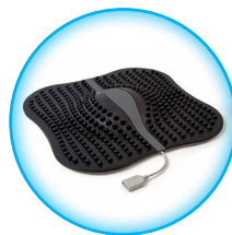
Электрод выносной терапевтический для стоп ДЭНАС-Рефлексо