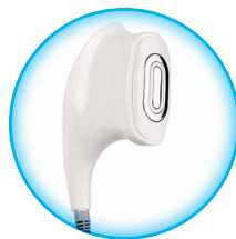
Выносной массажный электрод- площадка