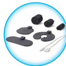
Комплект электродов выносных зональных ДЭНАС-Аппликатор

ИМЕЮТСЯ ПРОТИВПОКАЗАНИЯ. ПЕРЕД ПРИМЕНЕНИЕМ ОЗНАКОМЬТЕСЬ С ИНСТРУКЦИЕЙ ИЛИ ПРОКОНСУЛЬТИРУЙТЕСЬ СО СПЕЦИАЛИСТОМ