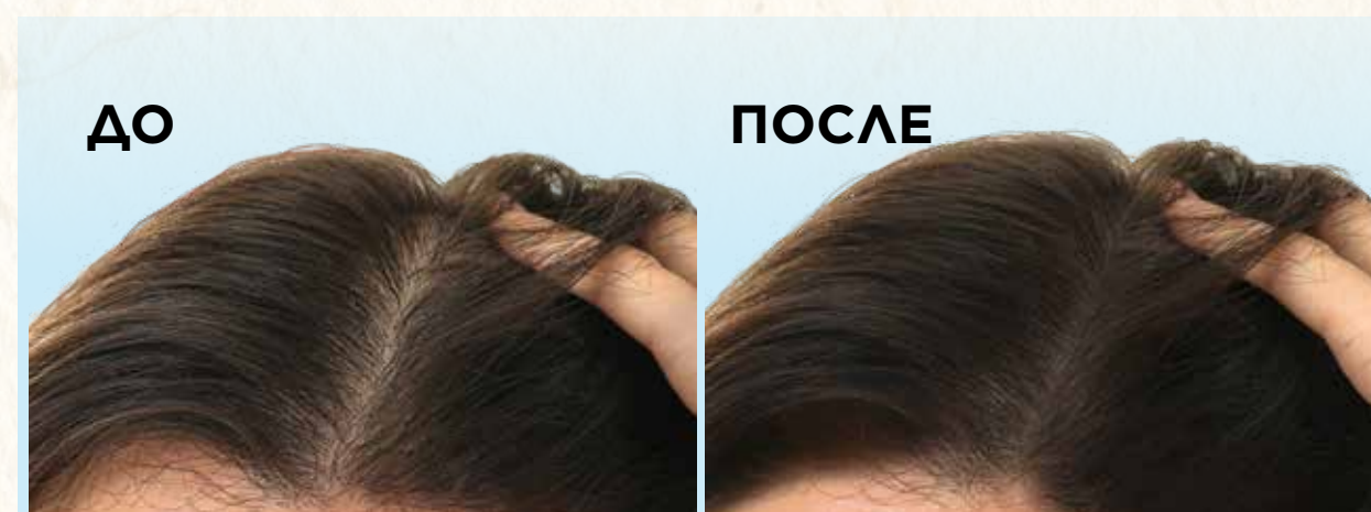
При регулярном применении