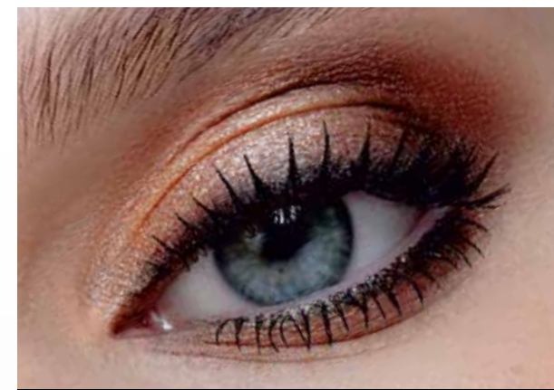
5127 молочный мокко