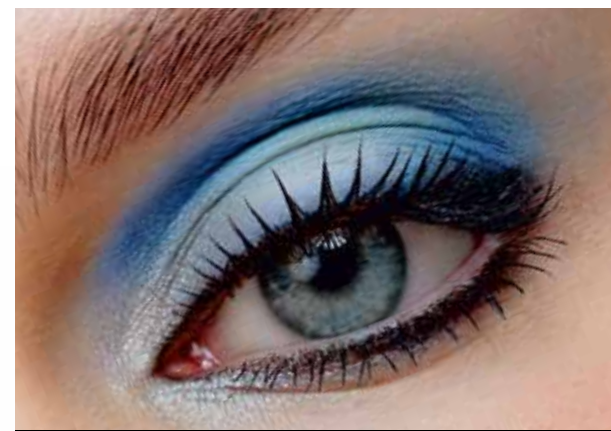
5121 сердце океана