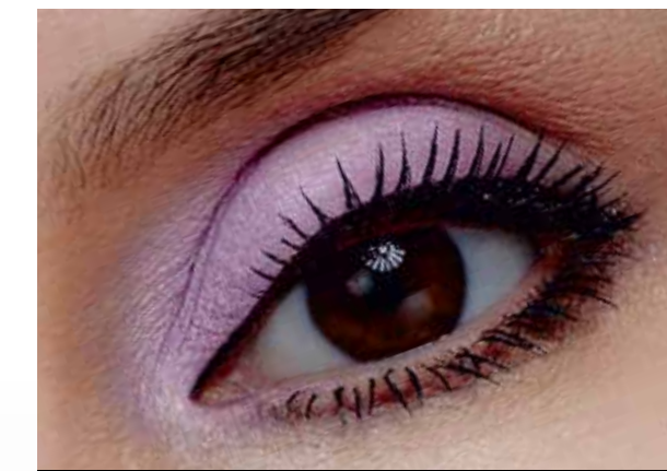
5129 лавандовая дымка