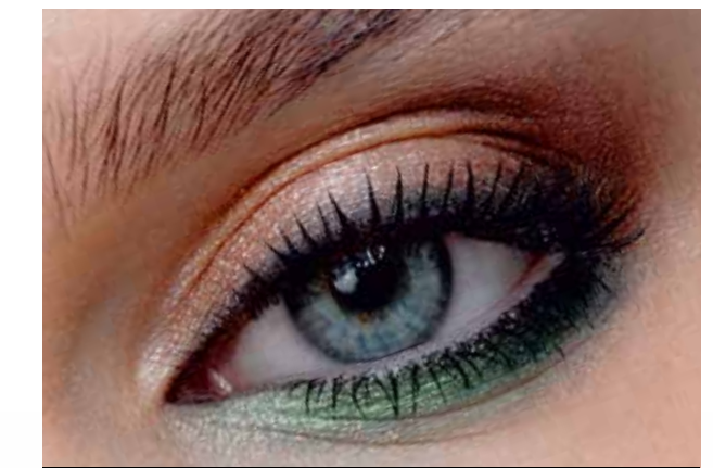
5120 лесная нимфа