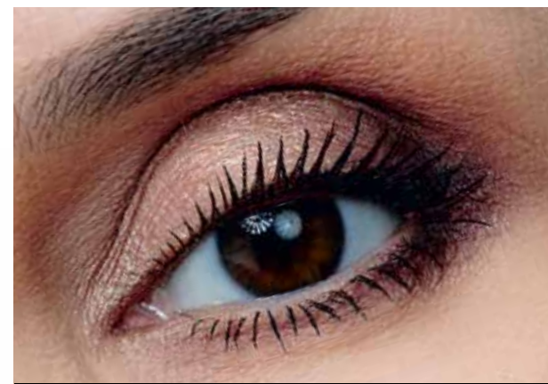
5128 роскошный махагон

• УСТОЙЧИВАЯ ФОРМУЛА: НЕ СКАТЫВАЮТСЯ И НЕ ОСЫПАЮТСЯ