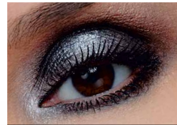
5132 черный бриллиант